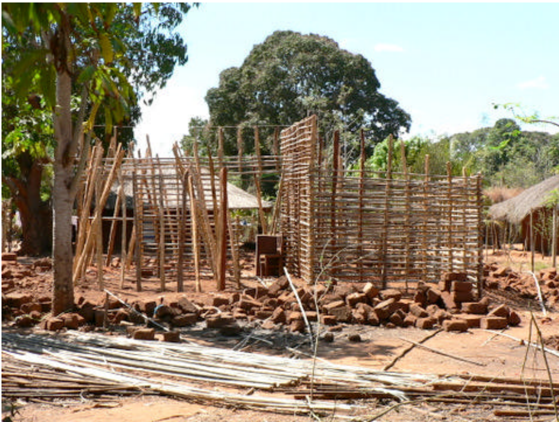
-Construcción de una Casa para la Cocinera de la Misión-

Así mismo, aprovechando la presencia de un grupo de Scouts en la Misión, colaboré con ellos en los trabajos de pintura de ciertas zonas de la misión (zona de biblioteca, árboles, etc...); así como, en la construcción de una casa para la cocinera de la Misión.