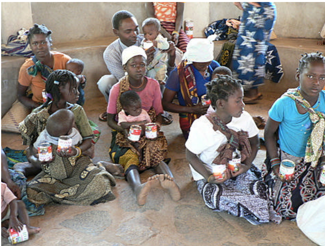
-Madres día de entrega de Leche en “Proyecto Isabelinha”-

Mi trabajo se centró, además de la ayuda en comprar y repartir la leche a las madres del Proyecto, en la toma de datos (madres atendidas, madres con vih, bebés con vih, bebés huérfanos, etc...) y actualización de las fichas de las madres.