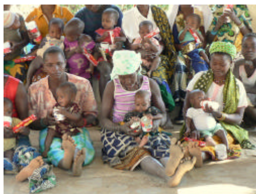
-Madres y Bebés Proyecto Isabelinha-