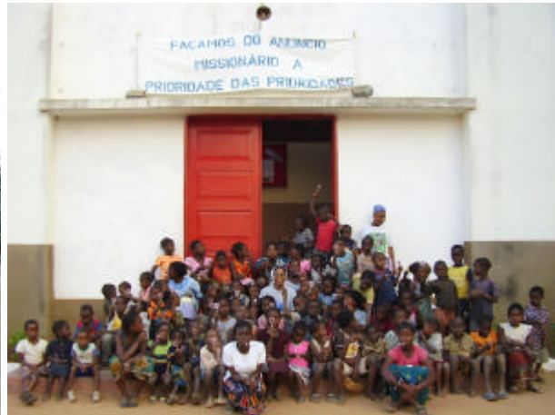
-Día de Oratorio en la puerta de la Iglesia-

Así mismo, aprovechando la presencia de un grupo de Scouts en la Misión, colaboré con ellos en los trabajos de pintura de ciertas zonas de la misión (zona de biblioteca, árboles, etc...); así como, en la construcción de una casa para la cocinera de la Misión.