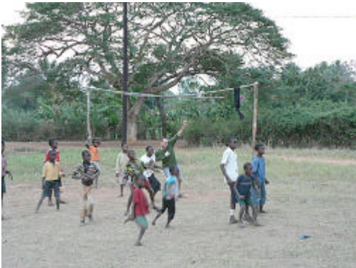
-Actividades en día de Oratorio-

Además de lo relacionado con el “Proyecto Isabelinha”, que era mi dedicación principal en la misión de Chiúre, también colaboré ayudando a las hermanas los días que había oratorio, organizando partidos de fútbol con los niños que acudían al oratorio.