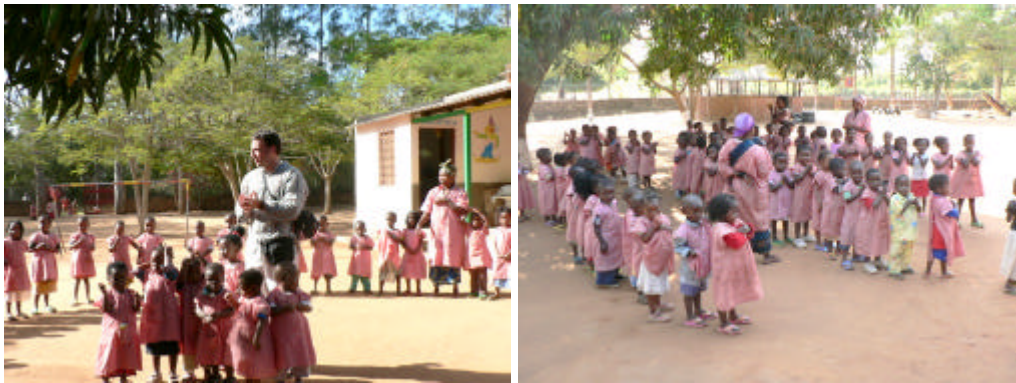
-Tiempo de recreo en la Escolinha-